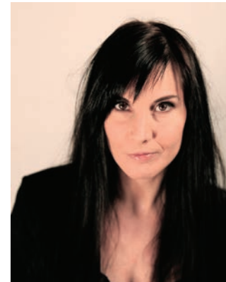
Gaële Boghossian comédienne, metteur en scène et auteur Marraine du Festival 2014

Femmes en Scènes est avant tout un bel acte artistique qui révèle la force et la volonté d'individus investis dans la cité. Car le théâtre est à l'origine, au centre de toute une vie sociale. Il rapproche, il suscite réflexion, analyse, émotion, douceur et violence. Il est acteur de rapprochements et d'envies. Les Femmes sont à l'honneur, leurs équipes en sont les vecteurs.